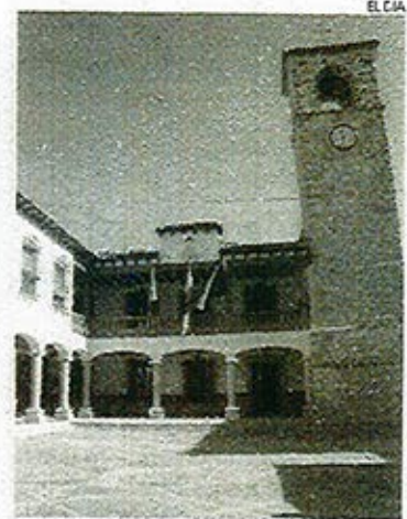
Consistorio de Mota del Cuervo.

Para IU, "los populares confunden intencionadamente los términos porque saben que la única deuda que puede considerarse oculta es la que se está generando desde que tomaron el poder, que no es otra que el cúmulo de facturas impagadas a proveedores, autónomos y empresas a los que tan-